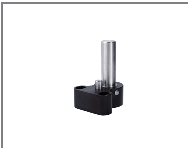
Адаптер тонометра (тип R) (Для аппланационного тонометра типу R)

(Доступний для S350/S350S/S350C/ S360/S360S/S390H/S390L)