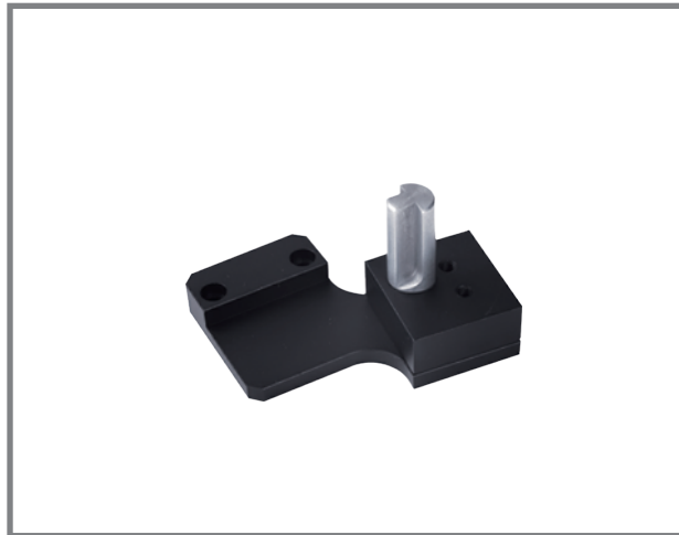
Адаптер тонометра (тип 870) (Для аппланационного тонометра типу 870)

(Доступний для S350/S350S/S350C/ S360/S360S/S390H/S390L)